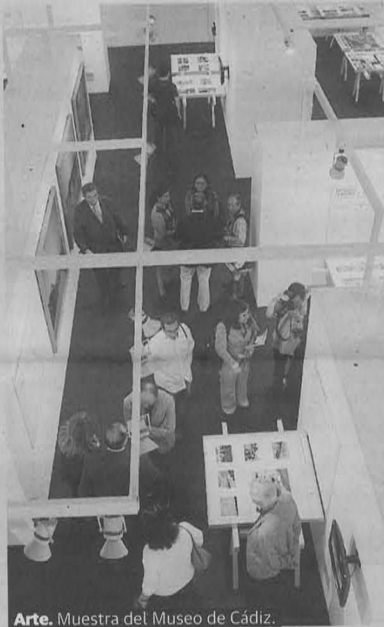
Arte. Muestra del Museo de Cádiz.

'Post-it. Ciudades ocasionales' pone el acento en los usos y ocupaciones temporales no reglamentadas del espacio público para actividades comerciales, lúdicas y sexuales en medio centenar de ciudades de todo el mundo. Los fenómenos 'Post-it city' centran su mirada en la realidad del territorio urbano como el lugar donde, de forma legítima, se solapan distintos usos y situaciones, en oposición a las crecientes presiones para homogeneizar el espacio público. Para los autores Martí Peran, Giovanni La Varra, Filippo Poli y Federico Zanfi, este tipo de prácticas urbanas aparecen, se desplazan y desaparecen.